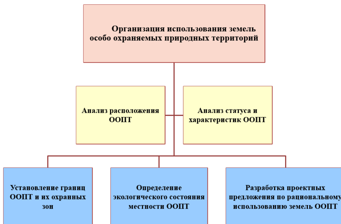
Рисунок 1 – Организация использования земель ООПТ

Месторасположение природного парка «Ингилор» – Приуральский район Ямало-Ненецкого автономного округа, Уральского федерального округа [1-3].